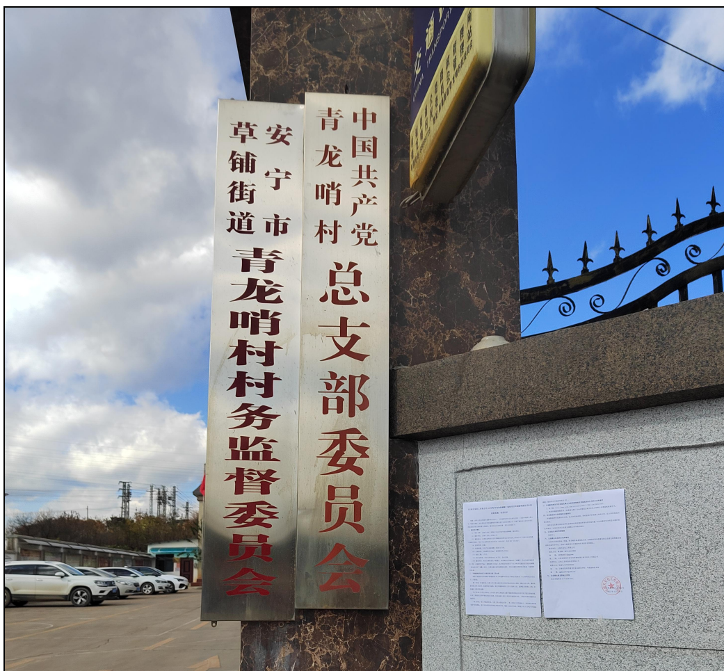
图8 青龙哨村现场公示图