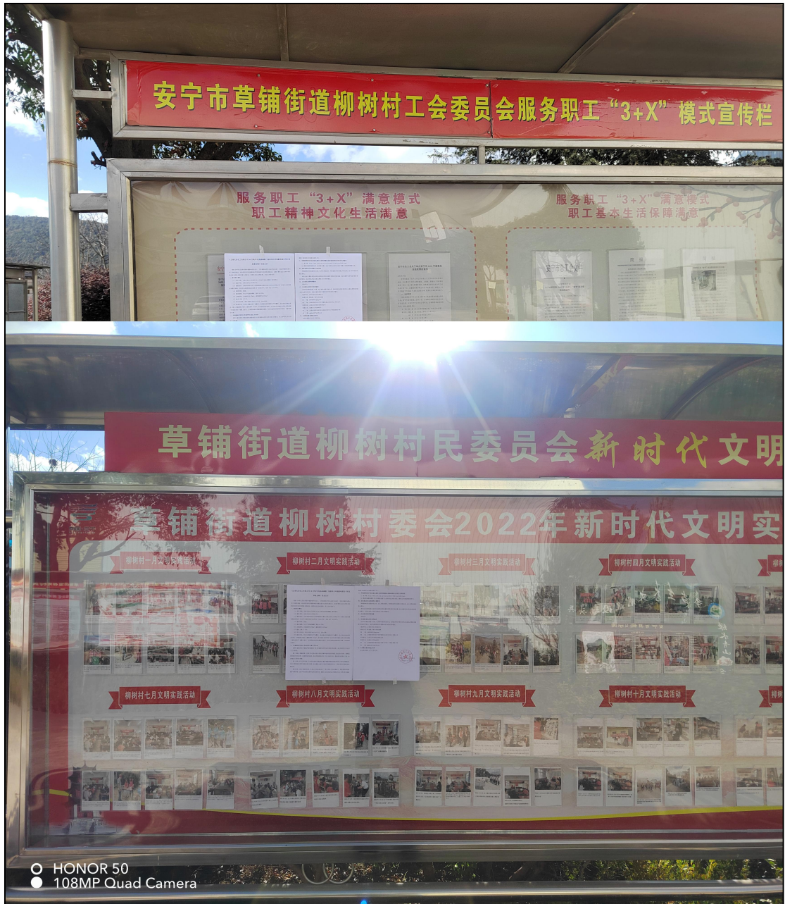
图7 柳树村现场公示图