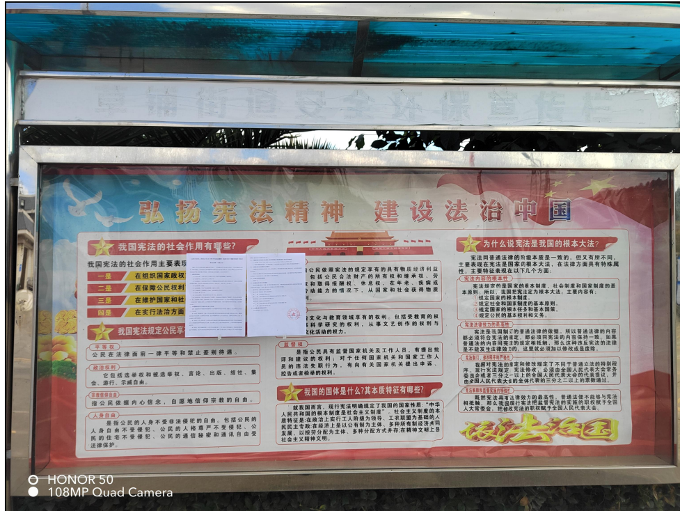
图5 草铺街道现场公示图

在草铺街道、柳树村、白土村和青龙哨村张贴公告张贴公告进行公示，符合《环境影响评价公众参与办法》中的要求。张贴照片如下：