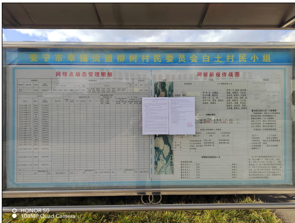
图6 白土村现场公示图