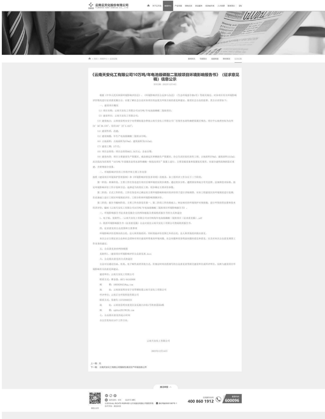
图2 征求意见稿网络公示截图